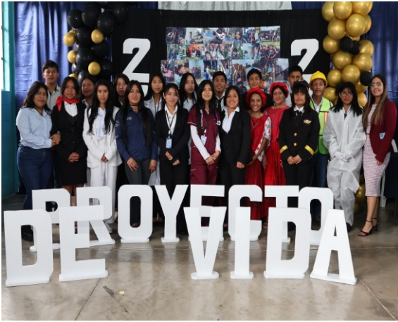
Presentación de Proyecto de Vida