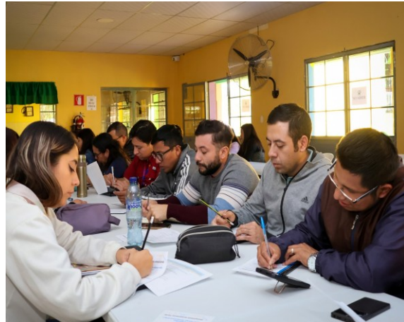
Actividades de formación docente